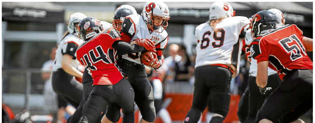
Die Scorpions Sisters zeigen vollen Einsatz beim Spiel.