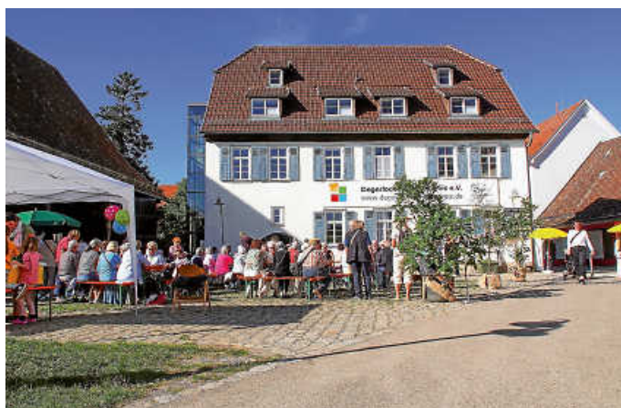
Auf dem Agnes-Kneher-Platz wird gefeiert.