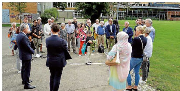
Heimspiel: Am Wilhelms-Gymnasium hat Nopper Abi gemacht.