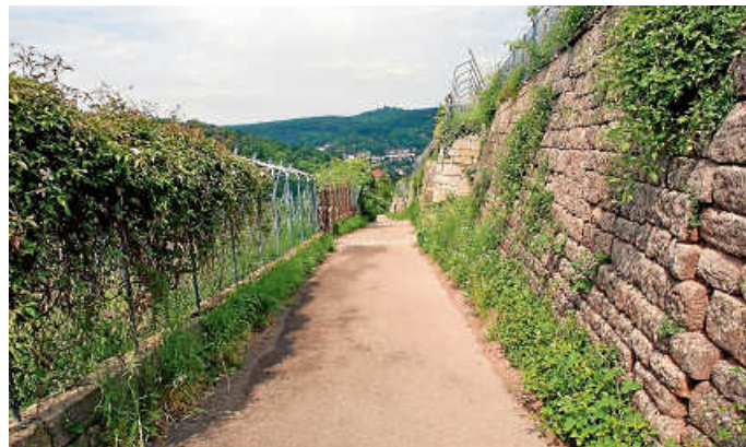
Wandern und Wein probieren im Schimmelhüttenweg.