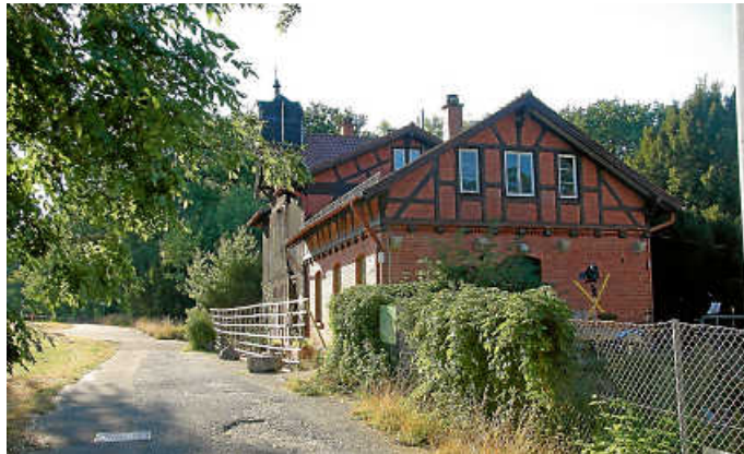
Das Ensemble Garnisonsschützenhaus ist geöffnet.

Seit einem Jahr plant das Architekturbüro Dannien Roller aus Tübingen die Sanierung und bereitet den Bauantrag vor (wir berichteten). Er soll noch in diesem Jahr eingereicht werden. Am 10. September werden der Projektleiter des Hochbauamts, Stefan Bauer, und die verantwortliche Architektin des beauftragten Büros, Ulrike