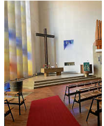
Musik in der Versöhnungskirche