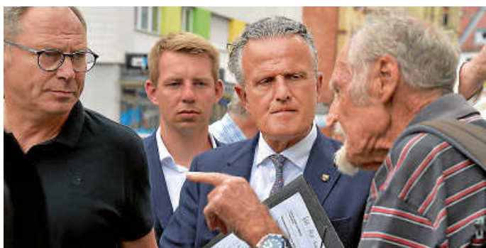
Beim Rundgang durch Degerloch bleibt genügend Zeit für Einzelgespräche.