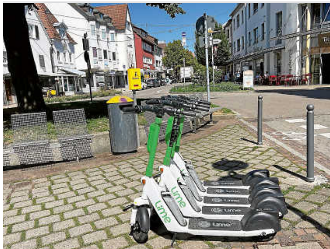
In Reih und Glied: E-Scooter sollen für weniger Ärger sorgen.

» Stadtbezirk. Ab heute wird's teurer: Die im VVS zusammengeschlossenen Verkehrsunternehmen haben eine Tarifanpassung von 7,5 Prozent zum heutigen Freitag, 1. September, beschlossen. Die höheren Ticketpreise werden vor allem Gelegenheitsfahrerinnen und -fahrer treffen. Rund drei Viertel aller Fahrgäste sind von der Tarifanpassung aber nicht betroffen, weil sie entweder das Deutschland-Ticket für 49 Euro im Monat oder das JugendTicketBW für rund 30 Euro im Monat haben, die beide preisstabil bleiben. (pb)