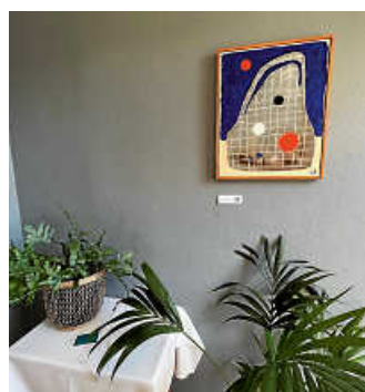
Hingucker im Restaurant Fässle

Kunst, Handel und Gewerbe schaffen in Degerloch eine Symbiose, die die lokale Gemeinschaft in vielerlei Hinsicht bereichert, indem sie die Kultur fördert, die lokale Identität stärkt und zur Entwicklung eines lebendigen Bezirks beiträgt. Die Zusammenarbeit zwischen Kunst und Handel ist daher nicht nur für Claudia Sack eine Win-win-Situation, sondern auch eine Investition in die Zukunft der lokalen Gesellschaft. (Petra Bail)