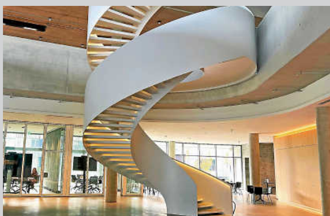
Schwungvoll elegant: das Epple-Verwaltungsgebäude