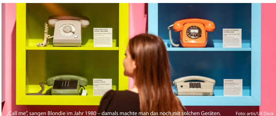
„Call me“, sangen Blondie im Jahr 1980 – damals machte man das noch mit solchen Geräten.

Heinz Rudolf Kunze stellte seine Gitarre bereit, Thomas Anders von Modern Talking den Bravo-Otto, Steffi Graf ihre Goldmedaille von Seoul. Und im November folgt ein weiteres Highlight: Udo Lindbergs legendäre Gitarre mit der Aufschrift „Gitarren statt Knarren“, die der Sänger 1983 Erich Honecker überreichte, findet dann ihren Weg nach Karlsruhe. Grund genug, sich einmal auf Zeitreise zu begeben, oder? (jr/tam)