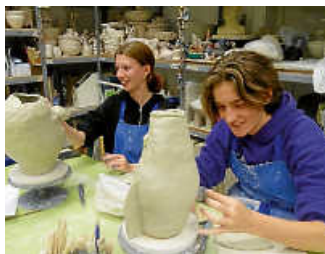
Kultur in Schulen

Info: Geplant sind jeweils dreitägige Seminare. Seminartermine: Stuttgart, 23. bis 25. Oktober, und vom 5. bis 7. Dezember. Anmeldung: www.lkjbw.de/schule-kultur-medien/kulturstarter (pb)