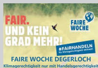
Das Motto

Als zentrale Aktion wird am Samstag davor von 9 bis 13 Uhr auf dem Lindenplätzle eine „Fairkostung“ angeboten. Schülerinnen und Schüler der Fritz-Leonhardt-Realschule werden dabei über Lebensmittel informieren, die unter gerechten Bedingungen hergestellt und gehandelt wurden, und zu ihrer Verkostung einladen.